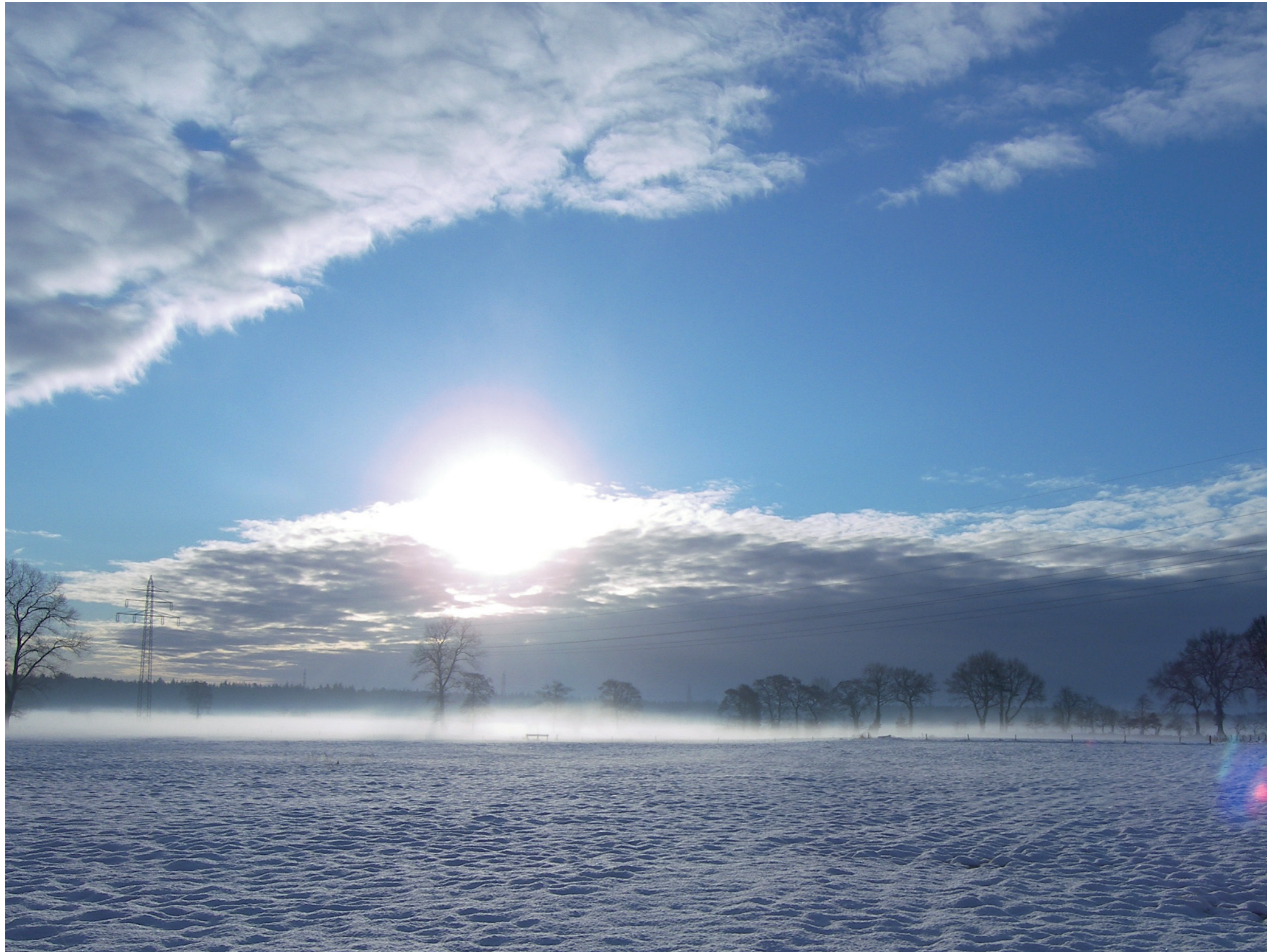
Aus dem dunkelsten Tag quillt plötzlich das lieblichste Licht hervor. Johann Kaspar Lavater