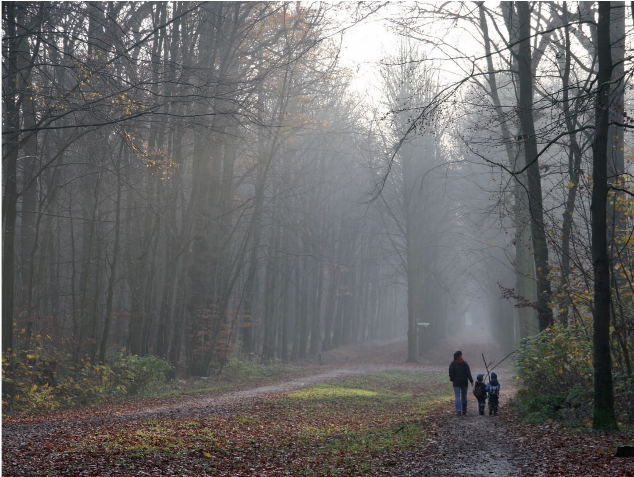
Wenn man die Natur wahrhaft liebt, so findet man sie überall schön. Vincent van Gogh