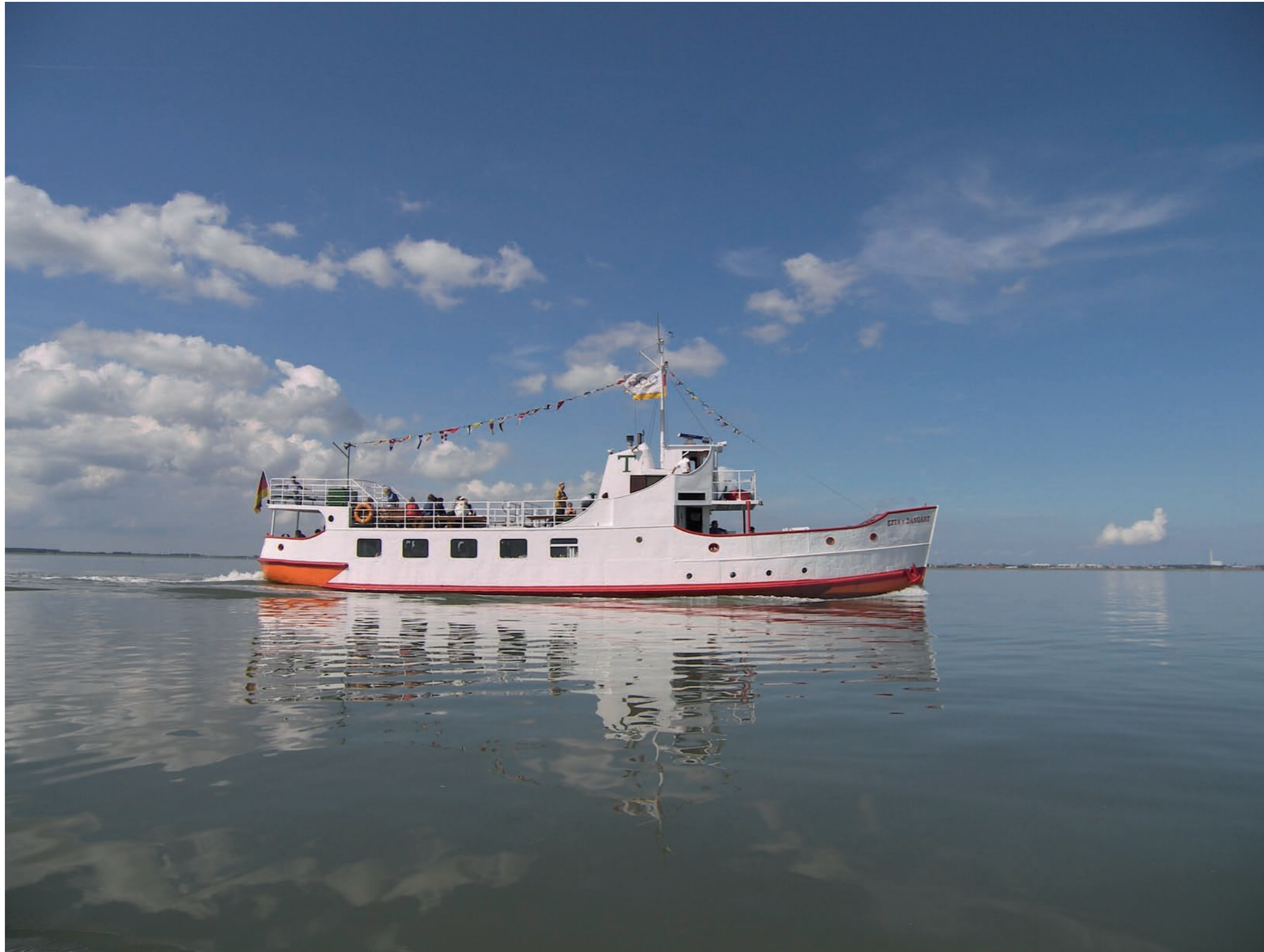
Jede Wolke hat einen Silberstreif. Aus England